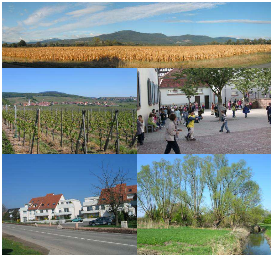
Schéma de COhérence Territoriale